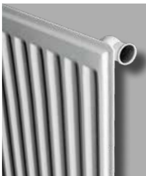
TYPE 10 / 11